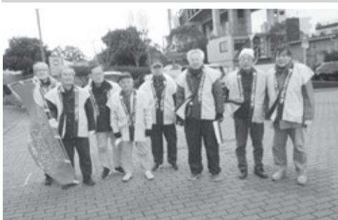
作業が終わって記念撮影する会員たち

1月9日(11日)に若松恵比須神社の十日えびす祭が催されましたが、若松区の会員は11日朝、