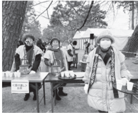
お茶係の女性会員

会員の役割は「お茶係、空席案内」と「誘導、行列整理」でした。行列は延々と続き、長い時は大手門近くの「しるこテラス」まで伸びていました。早い人は午前6時に並んだそうです。