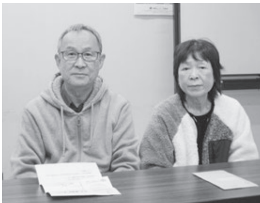
インタビューに答えるKさん夫婦 12月19日、本部会議室で

◆最初は令和5年3月のウオーキング大会です。それから、角島・元乃隅神社旅行、呼子・唐津旅行と今回です。どれも大変楽しかったです。今回は、別