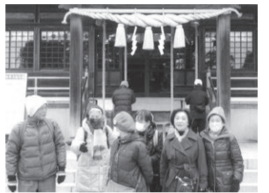
戸上神社で記念撮影

1100年余の歴史がある戸上神社↓平家一門によって安徳天皇のために築かれた飯御所の地区にある御所神社↓災いを祓う神様として信仰される門司八坂神社と門司区内3社を詣で、1年間健康に就業できるように祈願しました。