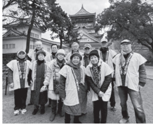
参加した会員たち

第67回小倉城おしるこ会が1月12日(月・成人の日)に開催され、当センター会員11人も水色の法被姿で運営に参加しました。寒波襲来の前日と違い、穏やかな晴天に恵まれました。