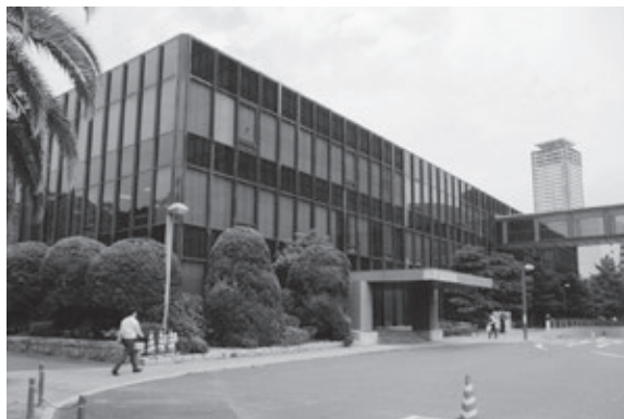
3人が就業する北九州市議会棟

議会を傍聴した経験のある会員はそれほど多くないと思います。私も実際に議場内で傍聴したことは一度もありません。そんな私が北九州市議会の本会議の傍聴者受付の仕事に従事しています。