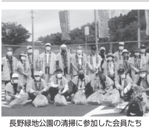
長野緑地公園の清掃に参加した会員たち