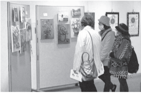
昨年のさわやかシルバー作品展会場