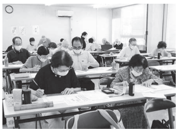
賞状書きに取り組む筆耕班の会員（9月12日）

八幡東、八幡西、戸畑各区の26人が、13日は門司、小倉北、小倉南各区の12人が参加しました。内容は両日とも卒業証書書きと賞状全文書き。午後1時30分から約3時間取り組みました。各班員が書いた賞状は11月の「さわやかシルバー作品展」に出店する予定です。