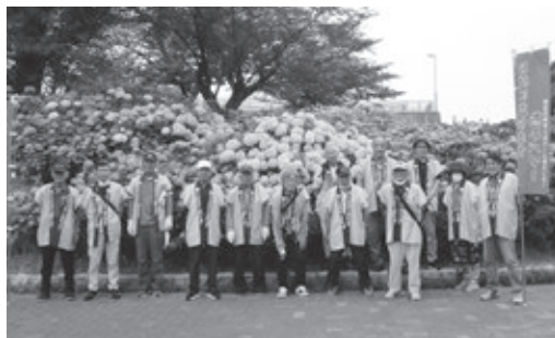
高塔山展望台広場周辺の清掃活動に集まった若松区の会員