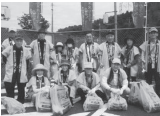
長野緑地公園で清掃奉仕した会員

小倉南区の会員は6月11日（日）、文化記念公園と長野緑地公園の2カ所でまち美化清掃活動をを行いました。 長野緑地公園では午前9時から理事のあいさつがあり、参加者16人が法被姿でボランティア袋と火バサミを手に聞き入っていました。その後、3コースに