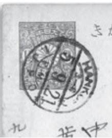
支那字入り分銅1銭5厘はがき(消印・1921<大正10>年9月5日HANKOW=漢口(現中国武漢))