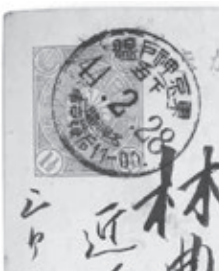
菊梓なし1銭5厘はがき(消印・明治44年2月28日東京神戸間)